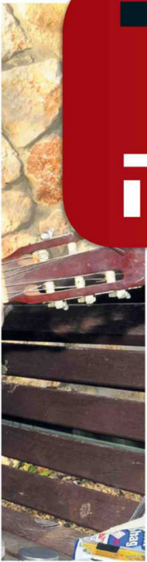
פת את הגוף - א"ג.

לאחר שהשתחרר מהצבא טייל בדרום אמריקה וחי בקנדה ובארזה"ב. כשחזר שבר דירה בפלורנטיין ועבר כמפיק הצ'נות, כנגן, כזמר וכמפיק מוזיקלי (בין היתר ניגן עם אמיר רדון, להקת "דרדנדר",