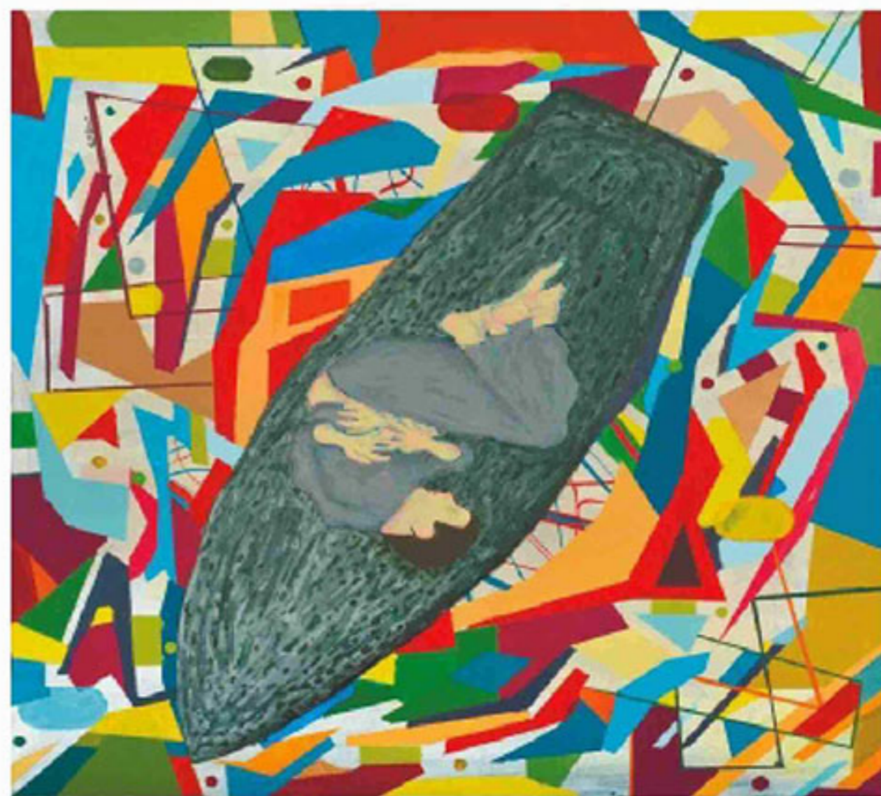
Luv-U-Bro, גיא שומרון, ישראל

מחלה אוטואימונית דלקתית כרונית נוספת היא הפסוריאזיס, מחלה בה תאי העור מתחלפים בקצב מוגבר. הגורם הישיר למחלה אינו ידוע, אם כי נמצא קשר גנטי מסוים למחלה וכי היא מתפרצת לעיתים בעקבות טראומה או לחץ. בישראל כ-120,000 חולי פסוריאזיס בדרגות חומרה שונות. ביטויי המחלה הם נגעים (פלאקים) בצבעי אדום-סגול המכוסים קשקשת, אולם מאחר שמדובר במחלה דלקתית סיסטמית - הרי שהפעילות הדלקתית מתקיימת גם באזורים אחרים בגוף ואף באיברים פנימיים.