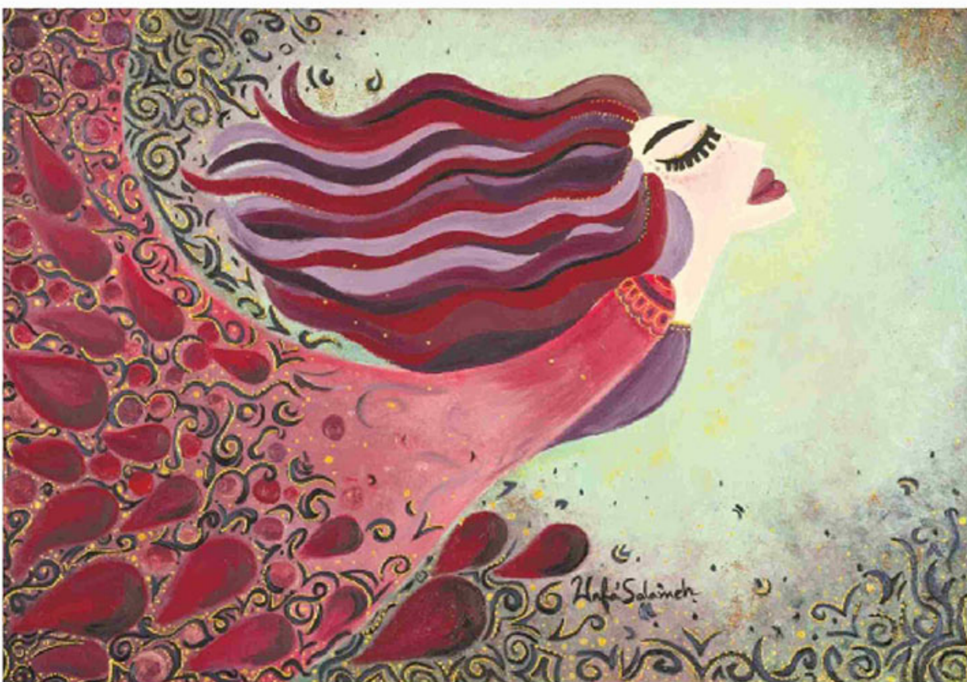
Wafaa Salameh, Dying... woke up to life again, ירדן

תערוכת "Perspectives - Art, Inflammation and Me" או בתרגומה לעב-